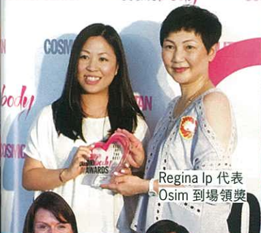
Regina Ip 代表 Osim 到場領獎