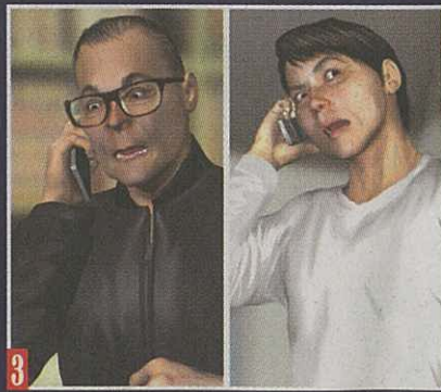
3 8 月中時，事主根據訊息顯示的電話號碼，致電對方查詢