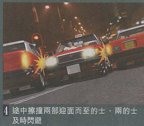
4 途中擦撞兩部迎面而至的士，兩的士及時閃避