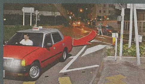
2 的士突切雙白線右轉而去