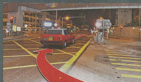
3 轉入太子道西逆線狂飆