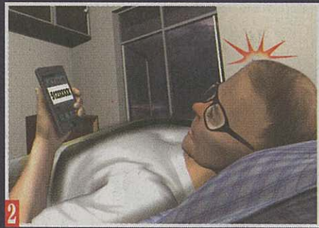
2 新電話號碼啟用僅 3 分鐘，「跟着我、跟着你」服務即彈出訊息，通知事主，一名陌生人所在位置