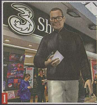
1 事主 8 月初在 3 門市選用新電話號碼簽新約出 iPhone 4