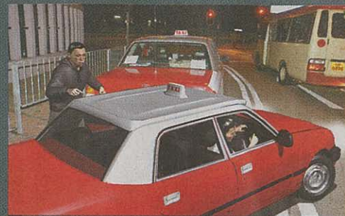
1 迷幻司機撞到前面的士車尾後，抽頭高速離去