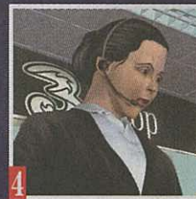
4 事主於 9 月初上網查看賬單，赫見電話費高達 1,117 元，大部份為追蹤服務費，致電客戶服務熱線投訴