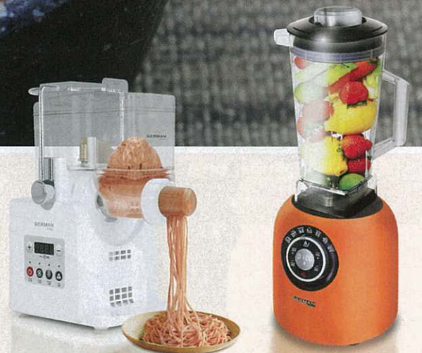
德國寶 PAM-181 自家製百變麵糰麵條機