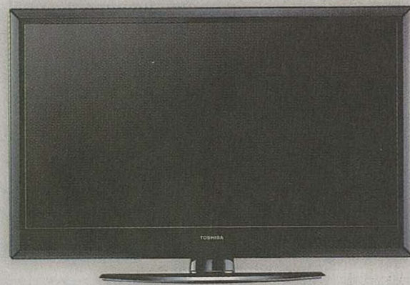
• 24吋型號最適合擺放於睡房之中，打機睇戲亦相當方便。

BF1 系列 iDTV 的 USB 端子更支援高速數據傳輸，透過內置的多媒體播放器即可直接讀取 USB 存儲器內的多媒體內容，支援播放 RMVB、XviD、H.264、MP3 及 JPEG 等格式，配合 REGZA ENGINE PRO 影像處理晶片，帶來更有「質感」的觀感體驗。BF1 系列亦備有 24吋、32吋、40吋及 46吋型號，不論在客廳、SOHO 工作間或睡房，均有合適的型號供用家選擇。