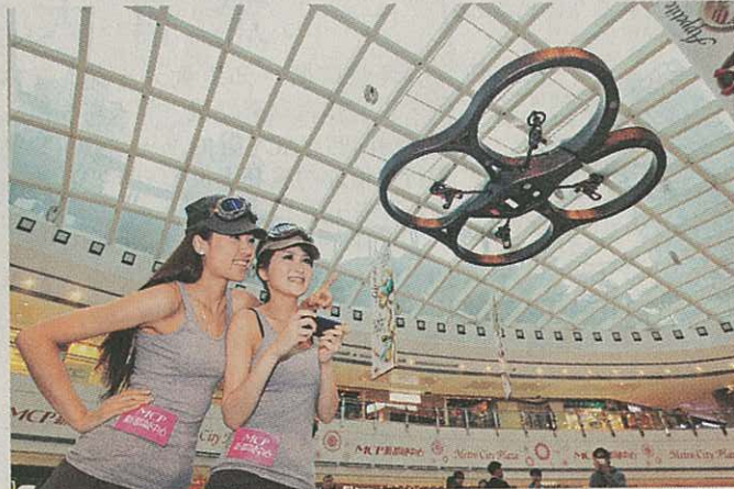
場內設有飛行試玩區，顧客可試玩iPhone遙控直升機。