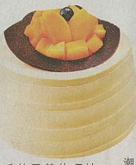
香芒雪芳的巧妙在於超鬆軟的雪芳蛋糕中加入滋味芒果夾心，配上朱古力脆米層作餅底，合口感層

工程師巧妙將音響設計的概念，應用在最新數碼音樂娛樂上！用熱情洋溢的奪目色彩配上內置充電電池，獨特「彈弓式」獨立低頻反射式音箱設計，融入只有5厘米直徑的殼結構，完美結合了建築美學和日本文化。並利用音響藝術，着重平衡度及聲音頻率反應，打造出專為文藝重播而設的流動