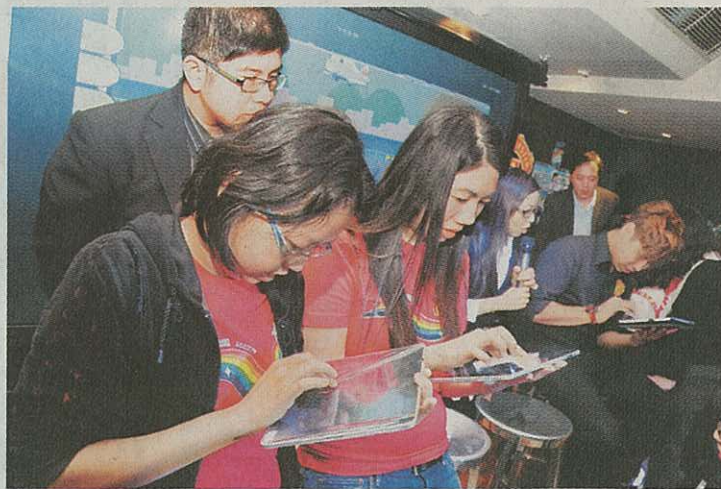
介紹會上不少人試玩「Fun Fly」。從他們的投入程度看來，可見這遊戲相當吸引。