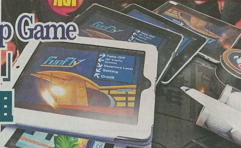
華航首創手機遊戲「Fun Fly」，除了趣味十足，還可教曉大家航空管理知識。