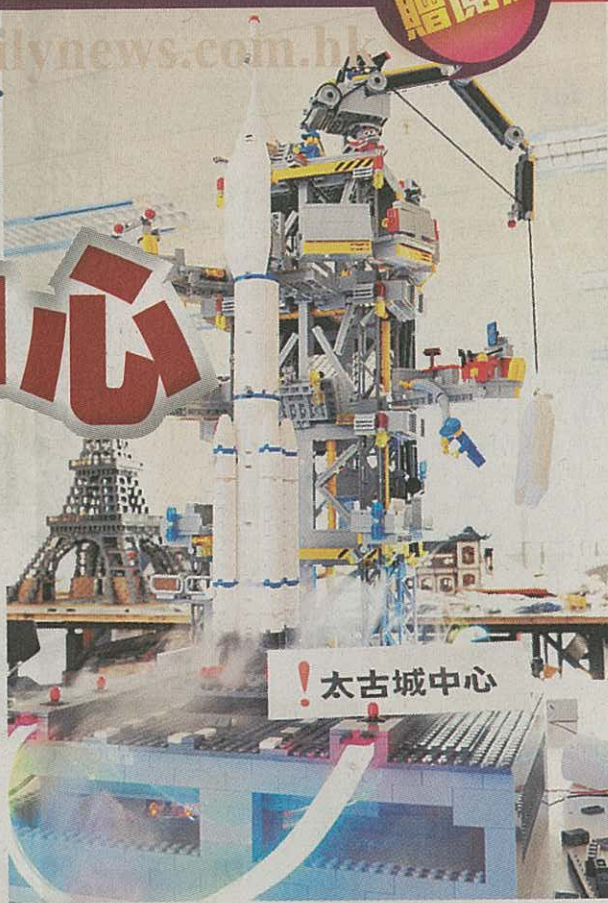
「環遊樂高世界」中的樂高名勝景點，更會加入煙霧及燈光效果。

同時，於展覽期間，太古城中心的APITA及玩具「反」斗城亦同時推出樂高折扣優惠，包括全線樂高產品九折發售，部份樂高貨品更低至八折發售，讓一眾樂高迷把樂高顆粒統統帶回家，繼續發揮個人小宇宙，拼砌一件件偉大傑作！