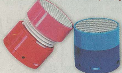
BonBonBeat內置充電電池，仲有5種顏色選擇。

Radius日本產品設計師，從大自然擷取靈感，以彩虹為主顏色及對比襯托顏色的選擇，令BonBonBeat內置充電電池、便攜式音樂播放器，成為充滿童真的小巧時尚必備品。