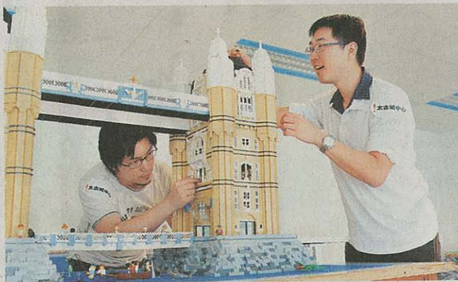
30位頂尖樂高創作高手，為展覽拼砌世界著名景點。