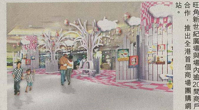
旺角新世紀廣場與場內逾20間商戶合作，推出全港首個商場團購網站

MCP新都城中心「潮人飛行夢工場」日期：即日起至4月25日 時間：中午12時至晚上9時 地點：將軍澳新都城中心2期及3期