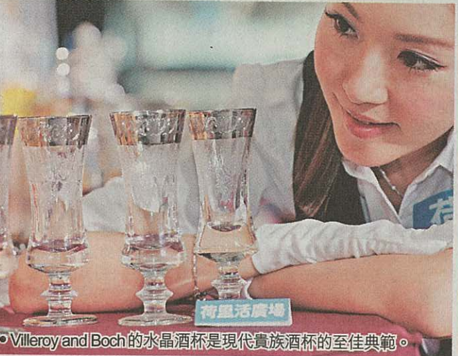
●Villeroy and Boch的水晶酒杯是現代貴族酒杯的至佳典範。

此外，6月17至19日，場內更將同步舉行「酒·樂荷里活2011」美酒展銷，一次過雲集了數十位展銷商，匯聚中西日韓環球名酒，包括紅白酒、干邑、中國、日本及韓式米酒等，種類繁多，以低至1折發售，例如原價$200的西班牙香檳Castell將以$20發售！而且，場內更設試酒區，歡迎大家免費試飲。