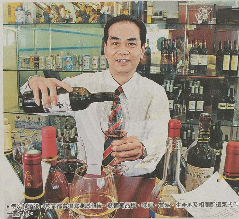
●每次試酒後，燕京都會撰寫測試報告，就葡萄品種、味道、質感、生產地及相關配襯菜式作一個紀錄。