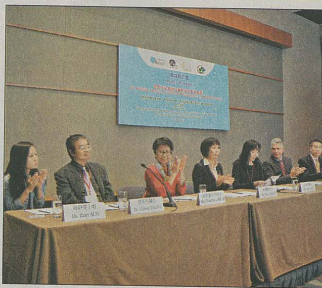
■香港過敏科醫學會等醫學組織，召開記者會商討空氣污染對 兒童肺部的影響。

天業路公園及球場鄰近濕地公園，可由天秀 輕鐵站徒步前往，市民亦可乘搭九巴路線264M、 265S、276B、新巴路線967、967X、969C或專線小 巴618號抵達。