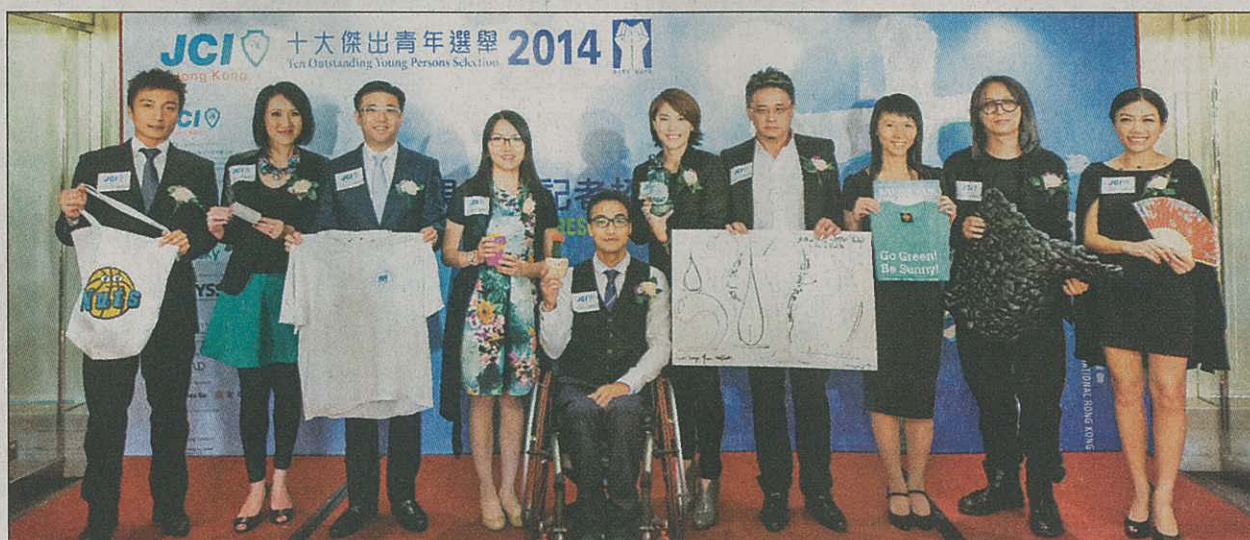
今年十大傑青得獎者拍照留念。

為表揚在工作上有卓越表現及對社會有貢獻，年齡介乎21至40之間香港青年而舉辦的十大傑青選舉，昨日公布本年度得獎者名單。選舉自2010年選出10位得獎人後，其後連續3年均只有9人或8人得獎，大會曾解釋要有合資格得獎者才會領足全部10個名額，今年終選出10位（得獎名單