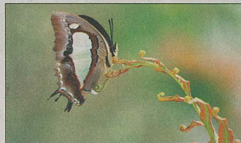
■窄斑鳳尾蝶屬於梅窩不常見品種。

10位得獎人中最為人熟悉的是藝人方力申，至今仍是兩個香港游泳紀錄的保持者。他回想當年既要上大學，又要游泳，更須兼顧演藝界工作，某日有家長對他說一定要大學畢