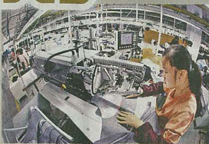
有港商指，內地官員受賄情況無太大改善，廠房升級轉型時要向相關部門進行利益疏通。