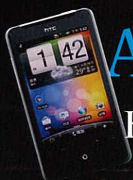
Android 詠嘆曲 HTC Aria

四隻蜘蛛一隻 Game Spiderman : Shattered Dimensions