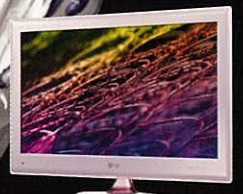
粉紅救兵 LG LE6500