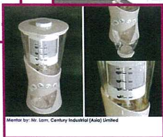
Mentor by: Mr. Lam, Century Industrial (Asia) Limited