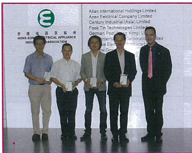
本會第三屆 Mentorship 計劃部分支持公司代表出席是日展覽