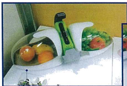
部分學生展覽作品