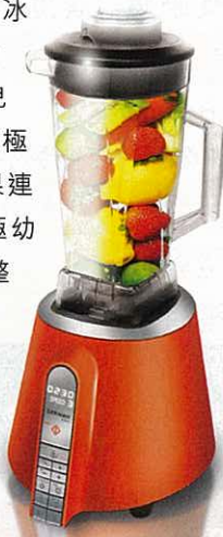
士瓜灣馬頭角道116號新寶工商中心高層地下2-4號室 ☎2773-2888 ㊦www.germanpool.com

德國寶全新推出的「自然養生攪拌機(Pro-9)」，由意大利設計師精心設計，機身採用時尚色彩，以銀黑色操控面板配液晶顯示屏，令「自然養生機」充滿濃烈的歐洲氣息，型格十足。內置多項快速功能鍵，只需一按即能炮製出蔬果、荳漿、醬汁、冰沙、濃湯、堅果食品及適合長者與嬰兒的易嚼食物。其配備極高速摩打，能將蔬果連皮和籽等部分打至極幼細，使你真正吸收整份蔬果的營養，達到保健、防癌及纖體於一身。