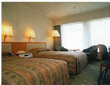
日航天地旅遊有限公司 ☎3429-1288 ㊦www.jalselect.com.hk

即日起凡參加由日航天地旅遊所舉辦的激安遊，且連續入住2晚札幌京王巴喇沙酒店指定房間之旅客，均可享半價優惠預訂1晚延期住宿房間。優惠期由即日~31/3適用，只限於預訂1晚延期住宿，往後之延期住宿需繳付回原價及只限「Standard」及「Stylish Floor」之2人住宿房間，並且需入住相同之樓層及房間類型，詳情請參閱網頁。