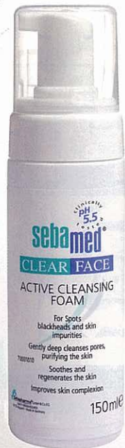
☎淨膚潔面泡 150ml / $92 謝美康Meka、萬寧、卓悅、莎莎及優質藥房有售。☎2774-8384

醫生和用家一致推介的粉刺痘痘潔面產品——Sebamed Clear Face「施巴」淨膚潔面泡；德國製造，含專利成分Montaline C-40，經臨床證實，使用二星期後痘痘數量明顯減少62%。無油無乳化劑，泡沫幼細，深入淨化毛孔；pH5.5中性配方，促進皮膚弱酸性保護膜形成，有效解決及預防痘痘、粉刺和黑頭等徵狀，用後清爽不繃緊，是一眾愛靚人士的喜訊。