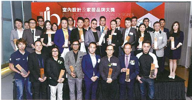
眾評審與得獎者於天際100頒獎禮現場合照