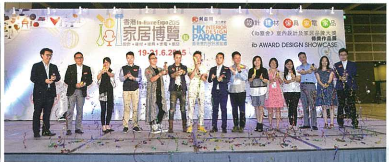
香港家居設計及用品博覽——ib Award Design showcase開幕禮