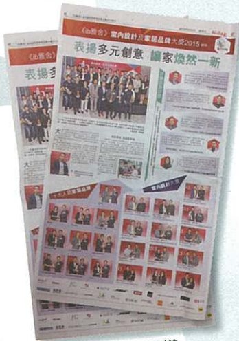
《經濟日報》專題報道