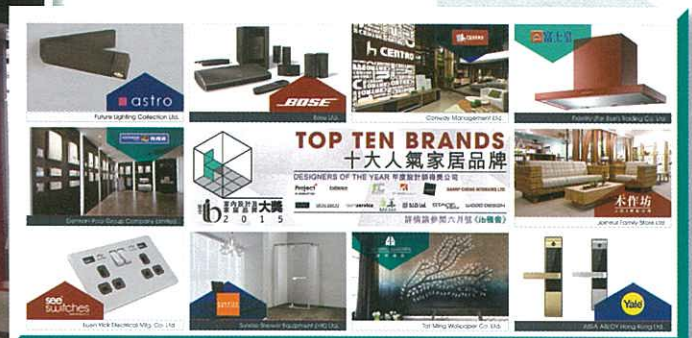
港鐵燈箱廣告（灣仔）