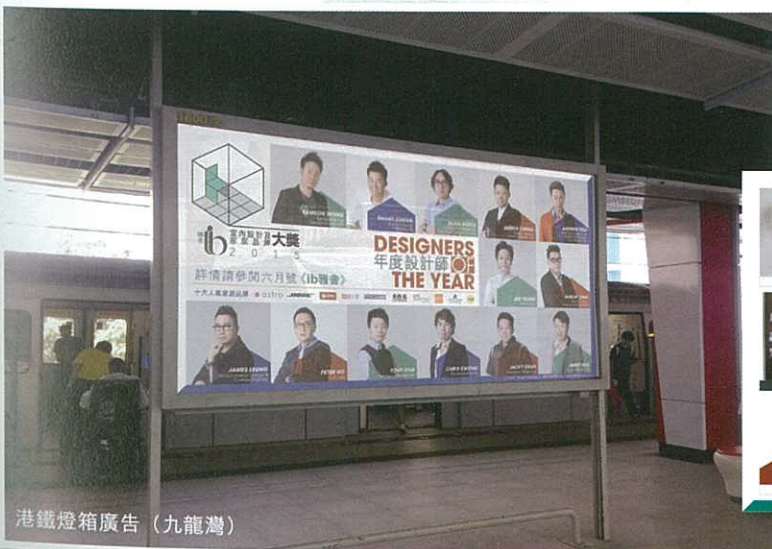
港鐵燈箱廣告（九龍灣）