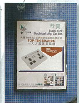
港鐵扶手電梯廣告