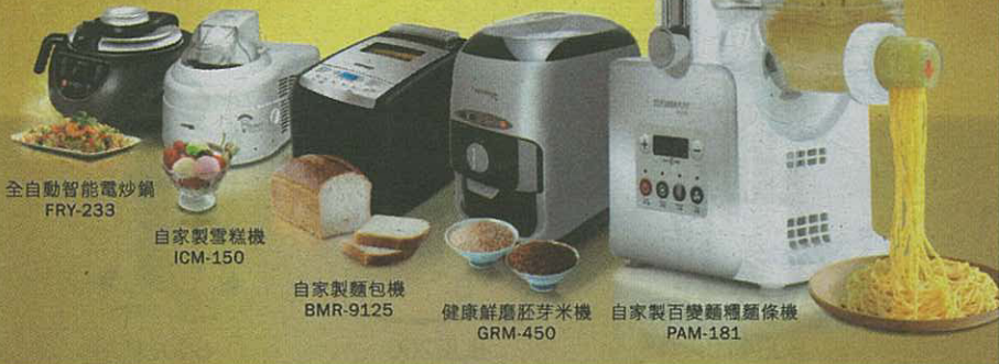
全自動智能電炒鍋 FRY-233