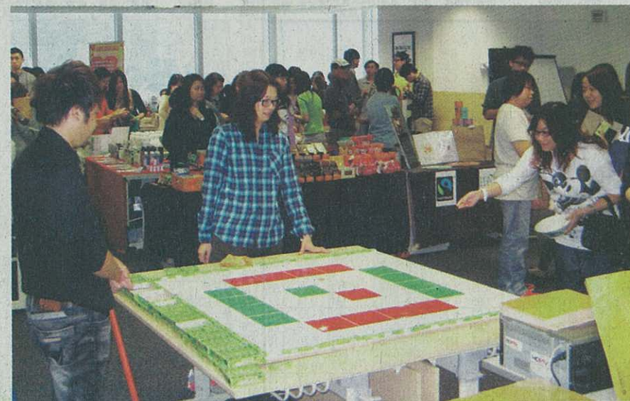
▲建行(亞洲)員工投入大笪地攤位遊戲，為辦公室增添趣味及歡樂氣氛。

除了精采活動，為了鼓勵員工持續關注身心健康，建行(亞洲)更在「生活與工作平衡周」內舉辦以「愛上星期一」、「腦有運動 輕輕鬆鬆健腦操」、「職場父母和孩樂」及「抗氧全攻略」為題的免費午餐講座，安排專家分享有關題目的最新資訊及經驗等。