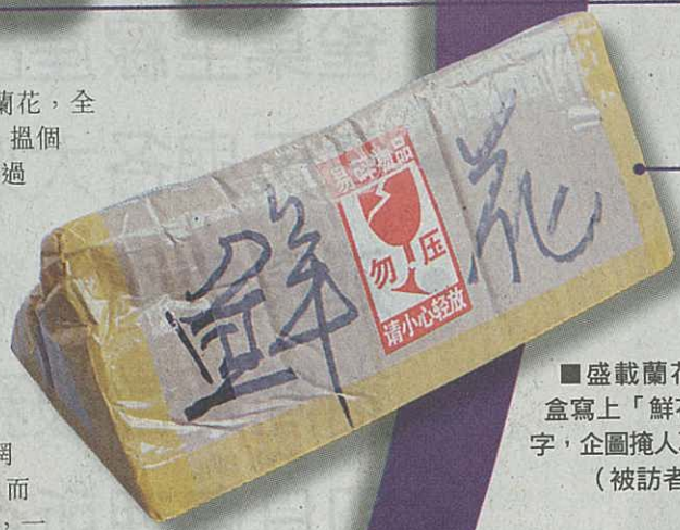
■盛載蘭花的紙盒寫上「鮮花」兩字，企圖掩人耳目。

立法會議員王國興斥責，海關疏於執法，任由瀕危植物在沒有許可證下入境。他認為，海關應立即加強抽查進口物品，以防情況惡化。漁護署發言人表示，網上買賣蘭花必須符合進出口及管有規管，而海關檢獲的非法進口蘭花會交由該署跟進，一〇年至一二年，在關口檢獲的蘭花個案共一百七十七宗。海關則指截獲未附有許可證的瀕危植物，會將案件轉交漁護署跟進。