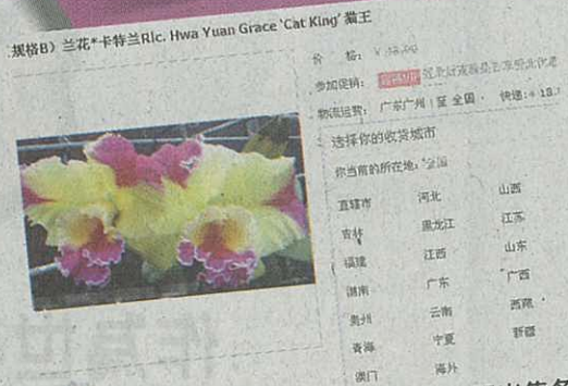
■內地購物網店公開出售各款蘭花，更指可直送本港。

「真正係台灣、內地或者外國入口嘅蘭花，全部都有專人包裝，絕對唔會求其塞咗紙碎，搵個紙盒包住就算。」鄧提醒，網上花店定價過低，有機會出售質素較低的「次貨」予顧客，而包裝過於馬虎，亦易令花朵受損，顧客光顧此類「網上花店」時要慎重考慮。