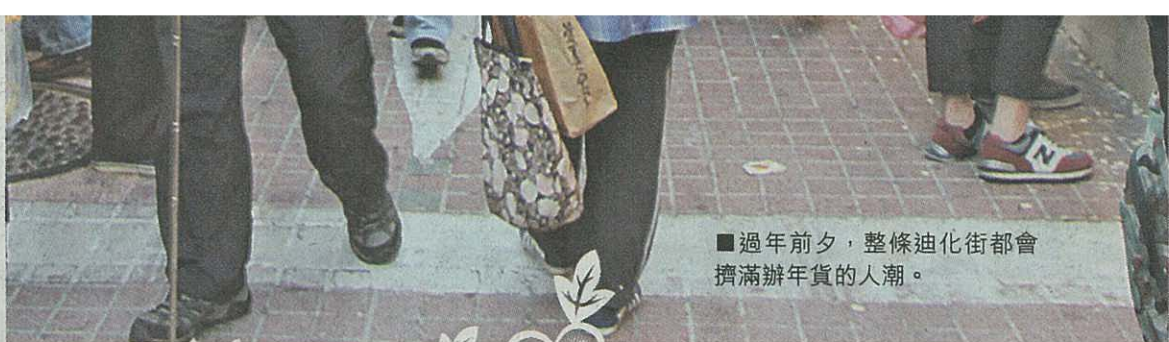
■過年前夕，整條迪化街都會擠滿辦年貨的人潮。