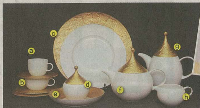
The Magic Flute Gold 餐具，a) & b) $2,160；c) $7,540；d) $1,750；e) $2,750；f) & g) $3,690；h) $300