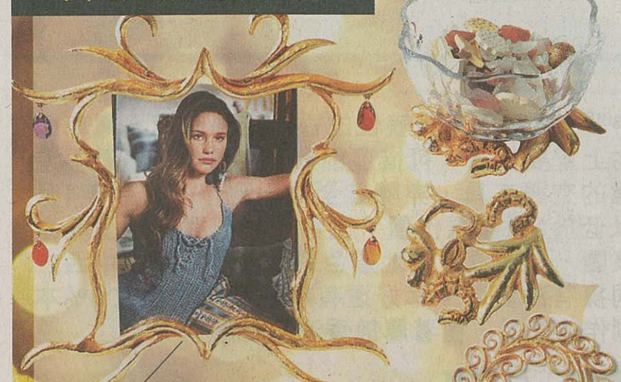
飾以吊珠的Art Deco裝飾邊框真金箔相架，讓相中人成為視覺的焦點，法國製造。$2,100

漆上金油的裝飾花底墊，美輪美奐，為桌子上不顯眼的玻璃盆子增添貴氣，意大利製造。$550(細)；$2,350(大)