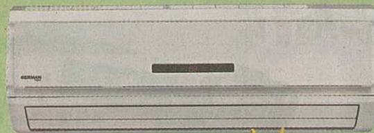
分體式冷氣機 ST-12 原價：$4,460 特價：$3,790 入場券可作$500用，折實特惠價：$3,290 (勁慳$1,170) 加送眼部按摩器 (價值$1,398)