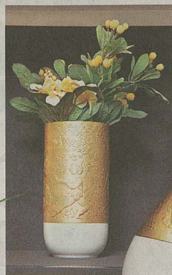
花瓶 20cm $5,080；22cm $3,170；30cm $5,050

Bjorn Wiinblad 是Rosenthal(羅森泰)磁器的首席設計師，在歐洲享負盛名，堪稱是個大膽且勇於多方嘗試的設計師，他的作品包羅萬象，涵蓋的範圍廣廣泛，舉凡磁器、玻璃、舞台布景、海報等……都有他的足跡，其中最引人注目的瓷器創作便是「Magic flute」，即「魔笛系列」(其靈感來自莫札特著名歌劇——還笛)；他個人極其喜愛神話及童話故事，作品有膾炙人口的「一千零一夜」系列(即「天方夜譚」系列)。