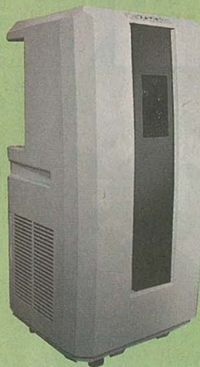
移動座地式冷暖空調MAC-15 原價：$9,980 特價：$6,980 入場券可作$1,000用，折實特惠價：$5,980 (勁慳$4,000) 加送頭部按摩器 (價值$2,538)