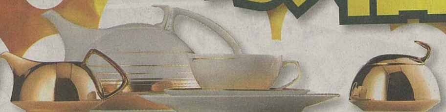
TAC Dynamic Gold系列，咖啡壺 $3,330；奶壺 $2,210；糖壺 $2,300；咖啡/茶杯連碟 $920