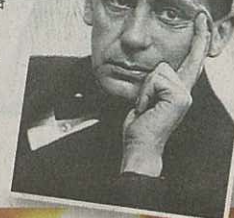
第一代現代建築經典大師 Walter Gropius (1833-1969)