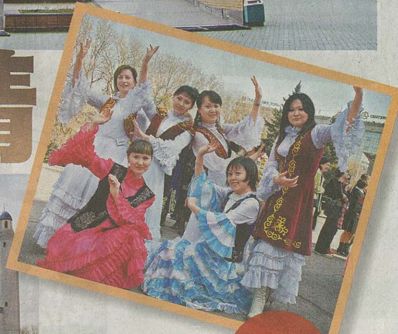
■哈薩克少女穿上民族服飾。