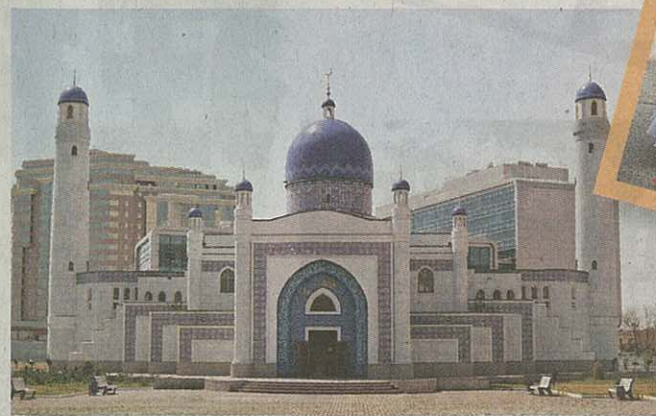
■這座宏偉的清真寺「Manjali Mosque」設於盛產原油的Atyrau市。

遂坐火車前往首都Astana，可一睹全世界最大的帳篷商場「Khan Shatyr」，體驗非凡的遊牧式購物。