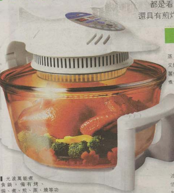
光波萬能煮食鍋，備有烤、焗、煮、煎、蒸、燒等功能。

都是看不見「煙火」的廚具，除兼備烤、焗、煮、煎、蒸、燒、烘、燉之功能外，還具有煎炸薯條、薯餅、花生、腰果等食物時無需加油，煲湯時防滾溢在內的更多功能。