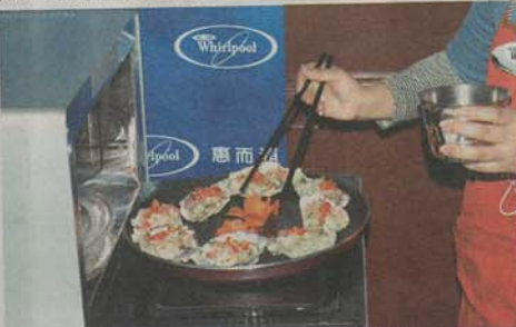
極速預熱功能，適用烹調鹽焗雞及焗生蠔等食物。

惠而浦同時推介 Chef Mama「脆智能」、Chef Vivo「型智能」不同型號，所有產品售價由1,698元至3,698元不等。