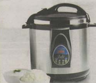
超級全能飯煲的烹調時間較普通煲具短40%。

■ 僅7分鐘極速可烹調「原隻杏汁焗官燕」，與傳統焗官燕需時幾小時比較，可有效縮短烹調時間。