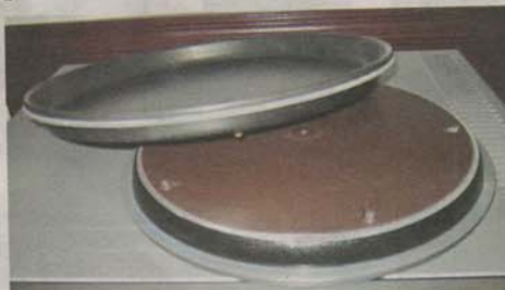
專利脆焗盤，只需加兩滴油，食品煮得外脆內軟、鬆脆可口，焗蝦片效果最明顯。