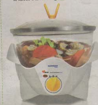
保健養生鍋透明鍋身，可透視烹調過程。