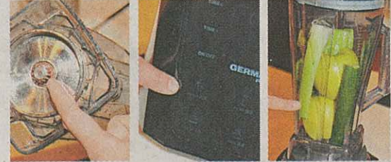
■ 底部有精鋼齒輪。 ■ 觸控面板具防水功能。 ■ 連皮和核打碎的五青汁。

售價：$3,680 (原價$6,130) 阿卓爸爸評語：測試中還有一款自製五青汁，由於這部機聲稱可把皮、核、莖等全部打碎變成果汁，所以今次帶備五青汁材料，在連核和果皮的情況下打碎變成果汁，看看是否真的勝於商用的果汁機？結果令人滿意，只要按下果汁功能鍵兩次，約兩分鐘，一整樽生果就變成果汁，喝下也沒有起渣的情況。 (攤位：1G07-10)