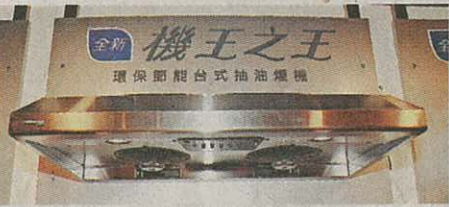
■ 這部自動感應熱能抽油煙機，勢必熱賣。

先進抽油煙機 自動感應熱能抽油煙機這個名很長，其實它內置一個熱感應器，一開啓火爐，抽油煙機就會自行啓動，不用左調右校，對家庭主婦來說，最重要功能是自動清洗，只須輕按按鈕（右圖），抽油煙機就會自動發熱和清洗，冬天時不用親手處理。