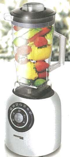
德國寶 PRO-10 自然養生機