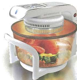
德國寶 CKY-888 光波萬能煮食鍋

一頓豐盛的晚宴，豈可沒有甜品壓軸登場？而一碗熱騰騰的鮮磨中式糖水自是最溫暖之選！德國寶自然養生機內置每分鐘超過30,000轉的超強馬力摩打，只需選擇「濃湯」自動程式，8分鐘即可一take過鮮磨芝麻、攪拌及加熱，美味養顏的芝麻糊就大功告成。自然養生機功能遠超一般攪拌榨汁機，無論冰沙冷飲、嬰兒食物、豆漿、濃湯、醬汁都能一按即製，簡易方便。德國寶自然養生機融合意大利匠心設計及全面功能，絕對別無他選。