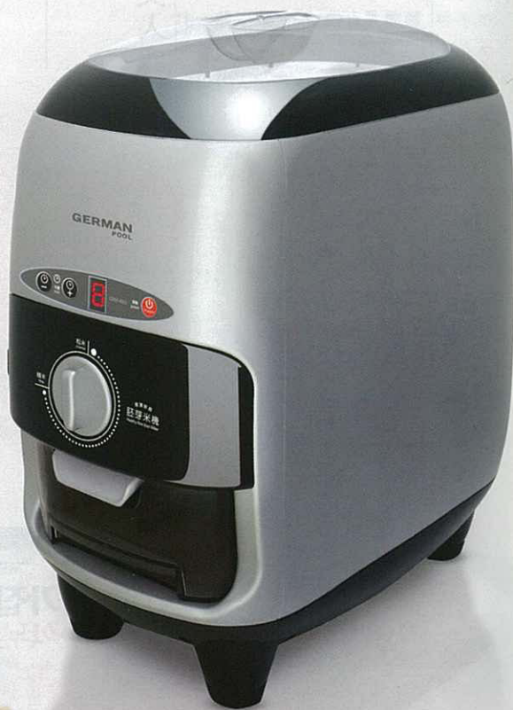
米の烘焙师：健康鲜磨胚芽米机 GRM-450

胚芽米机操作简便，设5公升特大米仓，开机即磨，毋须频繁添加糙米，即可研磨出胚芽米及营养米糠。更特设容量高达1公升的米糠仓，让用家轻松储起米糠作烹调或其他家居用途，毋须不断倾倒米糠。另外，还特设智型旋钮，让用家按自己喜好及需要选择精米度。