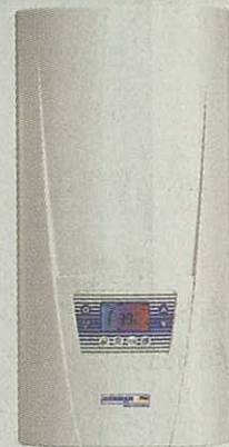
德國寶推出創新環保設計，以太陽能熱水器結合DEX電子即熱式熱水器。

最近，德國寶推出創新環保設計，以太陽能熱水器結合DEX電子即熱式熱水器。「太陽能即熱式熱水器」於有日照時採用太陽能加熱，完全毋須用電。於陰天或日光不足時，經太陽能加熱後的水雖未達至用家所需溫度，但仍會提升部分水溫；電子即熱式熱水器即根據用家所選溫度，以電力補充不足的水溫，準確地加熱至所選溫度。這款設計解決了一般太陽能熱水器未能於無日照時善用太陽能的問題，更免除不必要的電力消耗，節能環保。