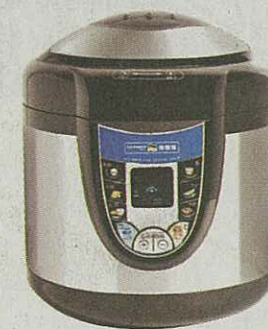
超級全能飯煲令一般需時較長的煮食過程，變得快捷簡易，同時節能。

不少中式烹調方式都需要較長時間，難免消耗不少能源。集合電飯煲、壓力煲、真空煲、燉盅、電鍋及焗燒鍋的優點於一身的超級全能飯煲，可以有效使焗燒、燉湯及煲粥等一般需時較長的煮食過程，變得快捷簡易，同時節能，彌補了眾鍋的不足。它更內置六種快速烹調功能，用途多樣化，包括煮飯、煲粥、燉湯、焗燒、熬煮及焗蛋糕等，烹調過程更毋須「睇火」。