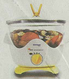
保健養生鍋恒溫設計有效節能省電

德國寶保健養生鍋是新一代電子燉湯鍋，兼具燉湯、烹調藥膳、煲粥、焗肉及烹製滷味之功能。養生鍋特別適合烹燉湯水或菜式，其獨特恒溫設計將食材及藥材慢慢滲入湯中，避免營養與藥性受大火蒸發而流失，因此更有效保留名貴食材如燕窩及參茸海味之精華，全面發揮滋補防病之效。恒溫設計更有效節能省電，連續運作四小時，消耗不到一度電，十分環保。