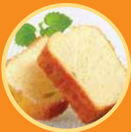
Sweet Bread 甜麵包