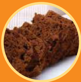
Chocolate Bread 朱古力麵包