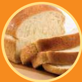
Sweet Milk Bread 牛奶麵包

A healthy day starts with a good breakfast. German Pool's Homemade Bread Maker is equipped with 12 programmes, using fresh ingredients with no additives. All you have to do is select a programme and delicious bread can be had all day, every day!