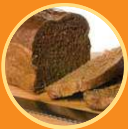
Rye Bread 黑麥麵包